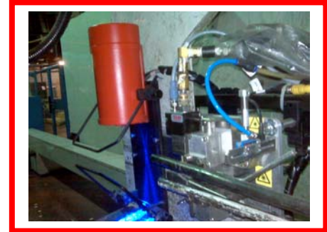
CAPTOR- Kamerasystem am BOARDRUNNER