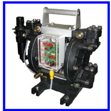
Hochleistungs-Leimversorgung mit präziser Leimdruckregelung