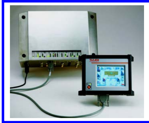
Leimauftragssteuerung MCP 12 / OT12 integrierte Leimüberwachung, Fehlerverfolgung, Fehlermarkierung