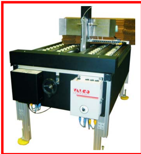
autom. Paketausschleuser hinter dem Bündeler für Leim-, Code-, Stanzfehler, QS-Entnahme usw.