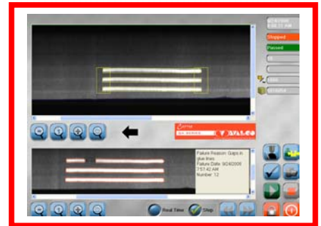
Leimbild mit Leimfehler auf Monitor