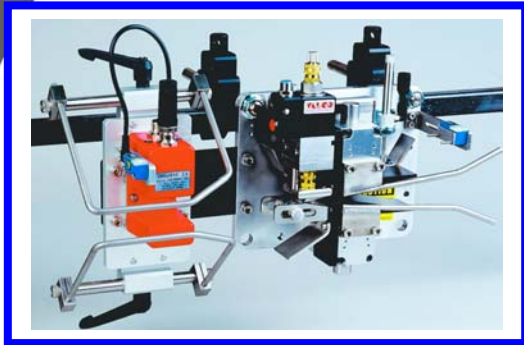
BOARDRUNNER : eine Station für Alles mit elektr. Leimventil für innen-, außen-, kontakt-, kontaktloser Leimung, mit Leimsensor für Leimung von oben und unten